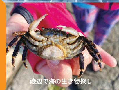
磯で海の生き物探し