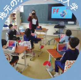
地元の小学校に体験入学