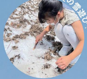
万年雪で夏の雪遊び!