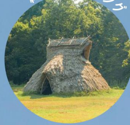
縄文トレッキング