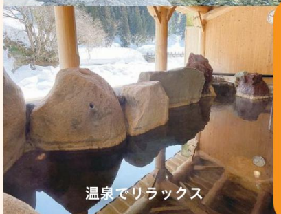
温泉でリラックス