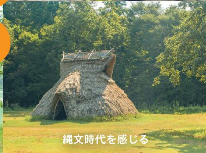
縄文時代を感じる