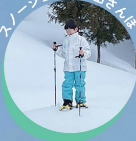
スノーシューで雪山さんぽ