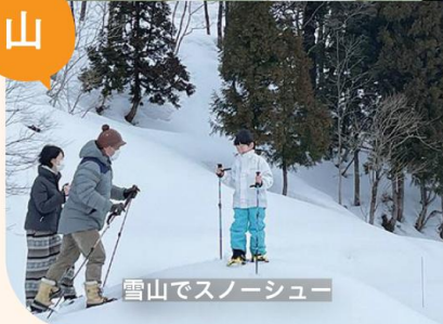
雪山でスノーシュー