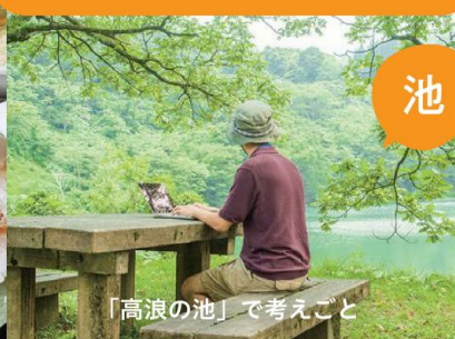
「高浪の池」で考えること