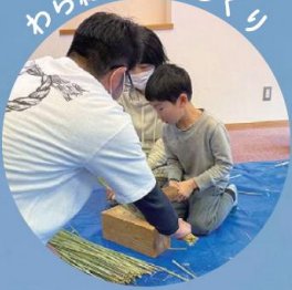
わら細工で剣づくり