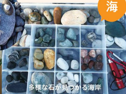
多様な石が見つかる海岸