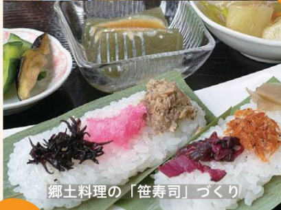
郷土料理の「笹寿司」づくり