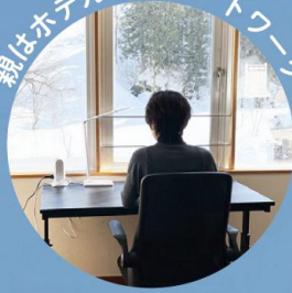
親はホテルでリモートワーク