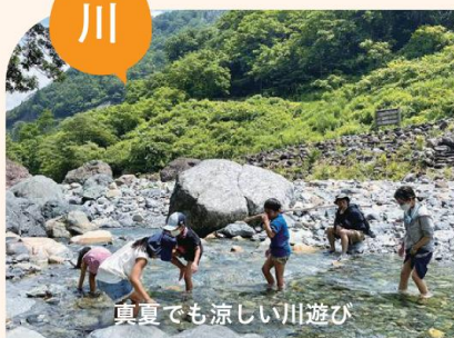
真夏でも涼しい川遊び