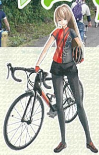
くびきりん 「久比岐 凧」 久比岐自転車道PRキャラクター