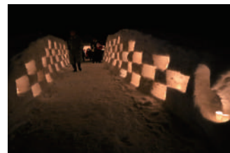
根知谷にきらめくキャンドルロード