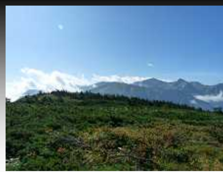
朝日岳山頂と朝日岳山頂の遠望、中俣新道から朝日岳まで一泊二日コース