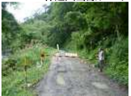
林道入山線ゲート

「林道入山線」ゲートからヨシオ滝まで小滝川沿いの作業道を歩く。ゲートからヨシオ滝までは1時間ほどを要する。