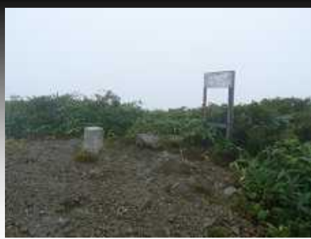
黒岩山(1,623.6m)山頂・珍しいサルのコシカケ