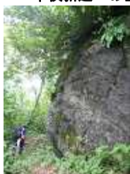
中俣新道一の巨大岩

標高 1,000m 付近。中俣山の中腹に中俣新道一の巨大岩が現れる。降雨時の雨宿りに利用可。