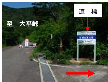
「林道橋立上路線」・「林道山姥線」分岐点

2 「林道山姥線」を道なりに車で10分程度進むと、坂田峠下の駐車場(34台駐車可能)に到着、林道金山線を歩き始めてすぐに坂田峠からの登山口につく。