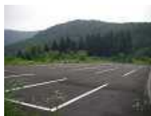
坂田峠登山口駐車場

2 「林道山姥線」を道なりに車で10分程度進むと、坂田峠下の駐車場(34台駐車可能)に到着、林道金山線を歩き始めてすぐに坂田峠からの登山口につく。