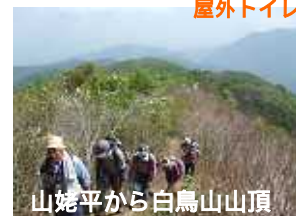
山姥平から白鳥山山頂