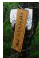
スズメバチ注意看板

3 坂田峠からは、白鳥山までの区間で一番急な登りとなる金時坂を登る。架設階段や補助ロープで登山道は整備されている。スズメバチには注意!