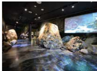
Fossa Magna Museum