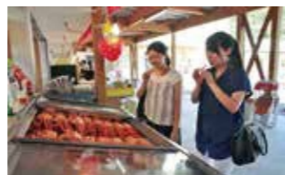
Marine Dream Nou