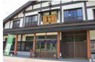
Watanabe Sake Brewery