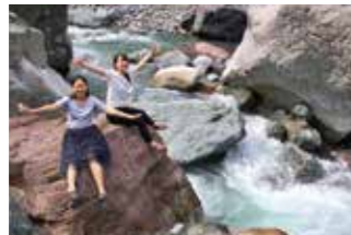
Kotakigawa Jade Gorge